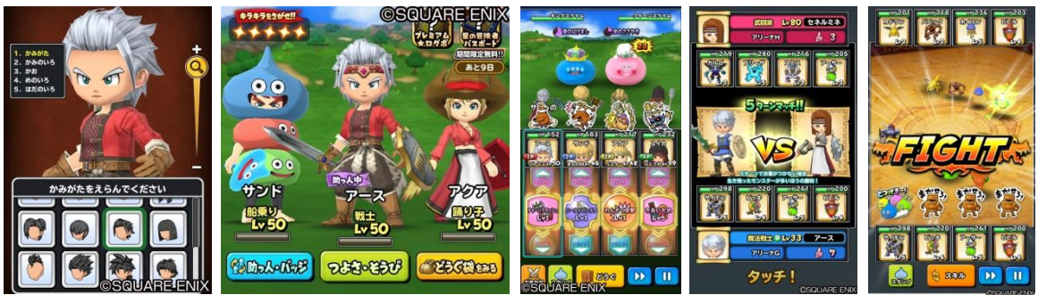
▲『星のドラゴンクエスト』ゲーム画面

さらに、2018年11月には新要素「モンスター闘技場」が実装。モンスターをスカウト・育成し、他プレイヤーの育てたモンスターとのバトルをお楽しみいただけます。