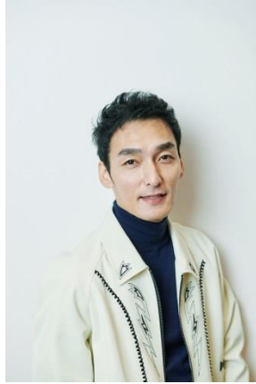
草彅剛 TSUYOSHI KUSANAGI