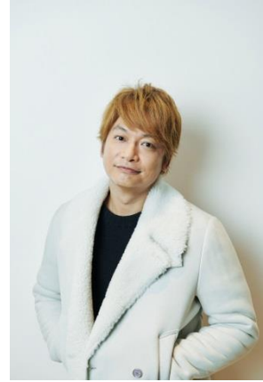
香取慎吾 SHINGO KATORI