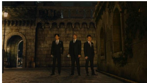
ギガ感謝祭 応援ソング 勇者篇

「新しい地図」の3人(稲垣吾郎さん、草薨剛さん、香取慎吾さん)が歌う「星のファンファーレ」のサビに乗せて、3人がスマホを見ると、その影がドラゴンクエストの勇者の姿に。スマートフォンの中で冒険する3人の姿を投影しています。新TVCMで使用している星ドラ応援ソング「星のファンファーレ」フルバージョンは、「5月27日ドラゴンクエストの日」のイベントとして5月25日(土)に幕張メッセで開催される「ドラクエの日 プロデューサー“ギガ”ミーティング」の会場で初お披露目する予定です。