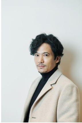
稲垣吾郎 GORO INAGAKI