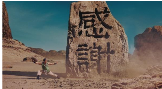
伝説の武闘家ジャッキー・チェン 扇篇 https://youtu.be/WcPdQVCGAMQ