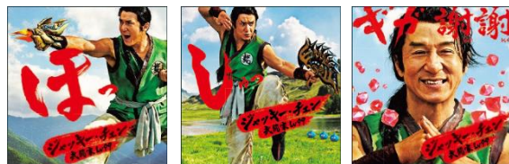
星ドラギガ感謝祭オリジナル“ガム”