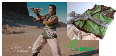
ジャッキー・チェンCMデザイン『武闘家の道着』

URL: http://www.dragonquest.jp/hoshidora/legendaryfighter/