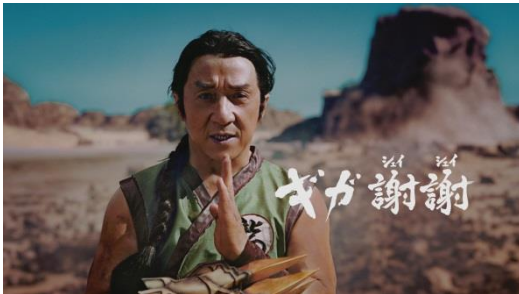
伝説の武闘家ジャッキー・チェン 登場篇 https://youtu.be/JPr6uP-auN8

踏ん張りすぎて破れたスポンからスライム柄のパンツが見えたり、間違えて素手で岩を叩いてしまい痛がったりと、カッコよく決めるアクションの中にコミカルな動きを織り交ぜたストーリー展開も見どころのひとつで、ジャッキー・チェンさんのシリアス&お茶目なキャラクターを最大に引き出しながら、短い時間の中でジャッキー映画作品に通じる世界観を再現しています。