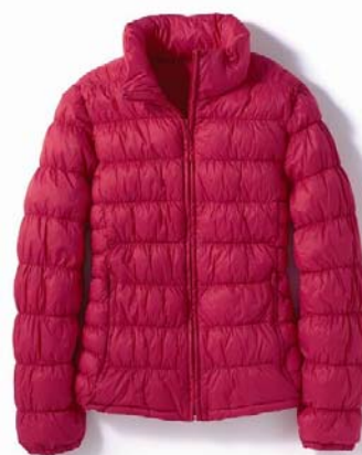
<レディースタイプ>

今年は冬も“節電”が一つのキーワードですが、この『ミラクルライトダウン』で、おしやれを“身軽に”そして“暖かく”お楽しみいただけます。