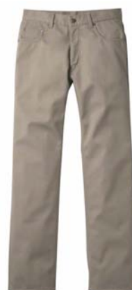
裏フリース 5 ポケットパンツ