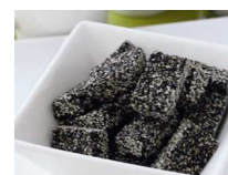
黒ごま生姜 ブロック (1 個あたり 25.9kcal)