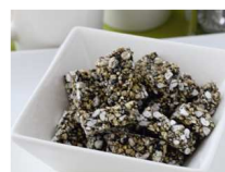
五穀ダイエット ブロック (1 個あたり 16.5kcal)