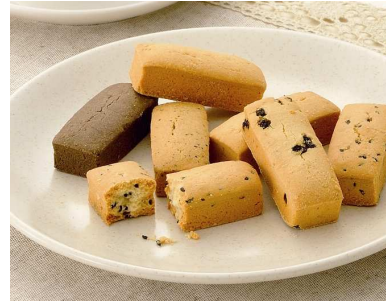
豆乳おからダイエットクッキーバー (1 本あたり 90.0kcal 以下)