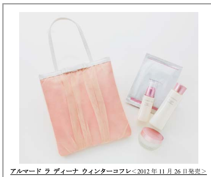
アルマード ラ ディーナ ウィンターコフレ&lt;2012年11月26日発売&gt;

株式会社セシール（本社：香川県高松市、代表取締役兼 CEO：上田 昌孝、以下 セシール）は、卵の殻の内側にある薄い膜“卵殻膜”を素材としたコスメブランド「アルマード ラ ディーナ」を展開中ですが、このたび、ローション、クリーム、美容液そしてフェイスマスクといった、人気の高いスキンケアアイテムを、エナメルとレース使いが印象的なデザインのリニートバックとセットにし、お得な『アルマード ラ ディーナ ウィンターコフレ』として、2012年11月26日（月）より、数量限定にて発売します。