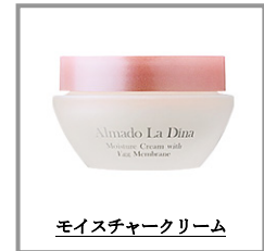
モイスチャークリーム

卵殻膜やスクワランなどの美容成分と、水分や油分の最適なバランスで配合した、モイスチャークリーム。コクがあるのに肌なじみがよく、肌の中にぐんぐんと浸透してしっかりとバリア。しっとりとした潤いとふっくら弾む肌へ。朝晩の通常のステップのスキンケアに使っていた他、アイクリーム、化粧下地としても。