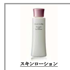
スキンローション

美肌の鍵であるⅢ型コラーゲンの生成をサポートする卵殻膜を主要成分とし、他にもヒアルロン酸やコラーゲンなどをたっぷり配合。乾いた肌をしっとりさせ、内側からハリ感を高める美容液効果もある化粧水。潤いを閉じ込めるために調整された水分と油分のバランスで、化粧水とは思えないほどとろみのある質感。