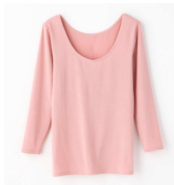
8分袖 (カラー：パウダーピンク)