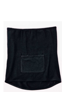
腹巻き (カラー：ブラック)

セシールでは、他に『ぷるすべ™』シリーズとして、カバーリング類(枕カバー、掛け布団カバー、敷き布団カバー、ボックスシーツ)、そして、卵殻膜成分を配合したスキンケア&コスメ「アルマード ラ ディーナ」も好評発売中です。