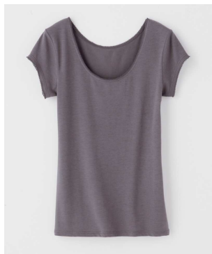
フレンチ袖 (カラー：オーキッドグレー)