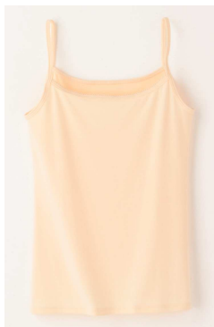
キャミソール (カラー：パールピーチ)