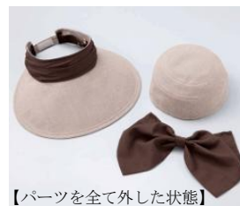
【パーツを全て外した状態】

3WAYで使用でき、エレガントでキュートなデザインの「3WAY帽子」。“キャスケット”やトップ部分を外して“バイザー”として、帽子後部のリボンを外して首元のガードとしてなど、シーンに合わせた使い方ができます。また、3WAYなのに大変お得な価格も魅力的なアイテムです。