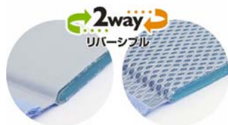
リバーシブル仕様

今や夏寝具の定番となった「ジェルマット」は、中材のジェルが体温を吸熱し、身体が離れると放熱することで、ひんやり感が持続し、エアコンなどの電気代の節約にも役立ちます。夏は綿 100% の表生地からダイレクトに涼感を感じることができ、春・秋はメッシュ素材の裏生地ですらっと爽やかに使用できるリバーシブル仕様です。