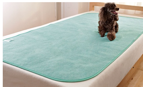
竹炭入り消臭除湿マット 3,990 円～ 2013 年 5 月 16 日発売