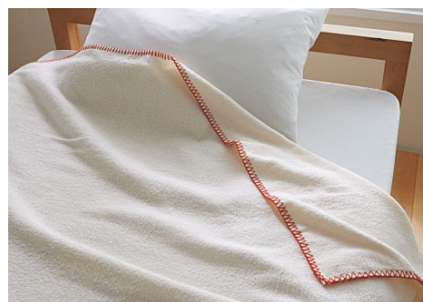
涼感ひんやりコットンブランケット 2,980 円 好評発売中

(1) 試験布を霧吹きで軽く濡らします(汗を想定)。 (2) 5分後の温度を測定します。水で濡れている為、未加工の場合も温度は下がりますが、キシリトール加工の方が大きく下がっています。