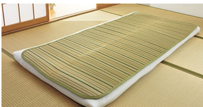
い草シーツ 1,980円～ 2013年5月16日発売