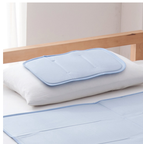
ひんやりジェルマット 6,990 円～ ひんやりジェル枕パッド 2,590 円 好評発売中