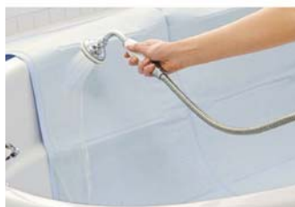
ご家庭で洗えます。