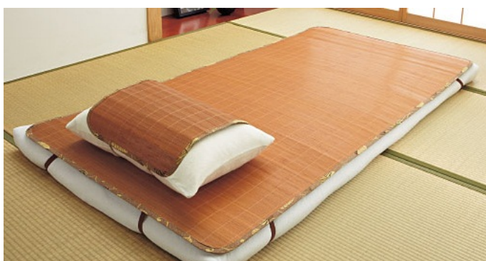
軽量ひんやり竹シーツ 3,980円～、軽量ひんやり竹枕カバー 890円 2013年5月16日発売