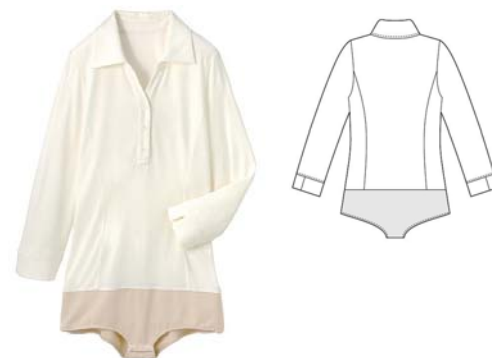
襟付きボディブリアー （品番：AA-737） サイズ：S・M・L・LL/3,990 円 3L/4,490 円

ベーシックで使いやすいソフトベージュ、ピンクベージュ、オフホワイト、ブラックの4色展開です。