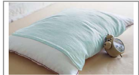
◆商品名…今治タオル枕カバー ◆販売価格…1,290円 ◆発売日…2013年7月1日

枕にタオルを巻いて寝ている女性が多いというアンケート結果に基づき、商品開発を行った「今治タオル枕カバー」は、ガーゼ面とパイル面のリバーシブル仕様で、肌ざわりにこだわりました。紐で結ぶ仕様ですので、枕の高さ・サイズに関わらず、お好みで枕にセットすることができます。また、タオル地なので、ご家庭の洗濯機で簡単に洗える為、いつでも清潔に利用いただけます。