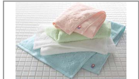
◆商品名…タットンタオル ◆販売価格…590円～1,190円 ◆発売日…2013年7月1日

セシールでは、東北復興支援のプロジェクトにより、福島で収穫された綿を5%使用し、光沢感のある超長綿をブレンドした糸でパイルを作った「タットンタオル」を発売します。今治タオルの技術で吸水性が良く、色合いも優しい4色で仕上げた、心のこもったタオルです。