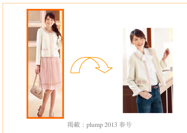
掲載：plump 2013 春号

ドレスアップはしたいけれど、一回きりで着なくなるのはもったいない。そんなお悩みを解消する、着まわし力抜群の、便利で大人可愛いアイテムが登場しました。ハレの日は贅沢なレースのセットアップで上品に、普段使いにはデニムやボーダーなどに合わせて品よくカジュアルダウン。シーンに合わせてお好みのスタイルで着こなせます。