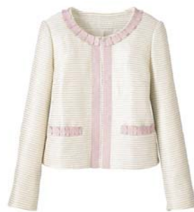
ノーカラージャケット（品番：AL-231）