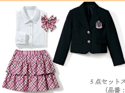
5点セットスーツ (女児) (品番: TC-928) 110・120・130・140/6,990円 掲載: キッズセシール 2013 春号 (P.58)