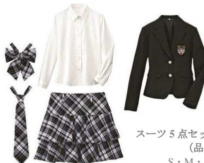
スーツ5点セット (エンブレム付き) (品番: TW-26) S・M・L・LL/9,900円 掲載: CUPOP 2013 春号 (P.48)