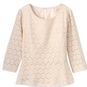
レースプルオーバー（品番：AX-618）