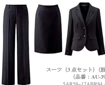
スーツ (3点セット) (股上やや浅め) (品番: AU-392) 5AR58~17ABR84/7,900円 19ABR88・21ABR92/8,900円 掲載: レディースセシール 2013 春号 (P.128)

ほどよいシェイプが女性らしさを感じさせるジャケットに、ベーシックなタイトスカートと美脚効果にこだわったセミブーツカットパンツがセットになったお得な3点。ご家庭の洗濯機でザブザブ洗えるからいつも清潔に着られて、クリーニング代の節約になります。