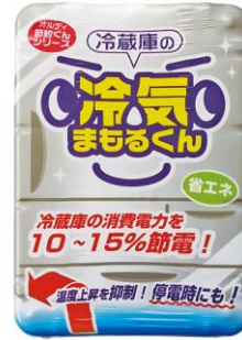
冷蔵庫の「冷気まもるくん」(品番: WA-147) 1,200円 (税込)

冷蔵庫に入れるだけで、約6°Cで凍る特殊ポリマーが冷蔵庫内の温度上昇をセーブしてくれる「冷蔵庫まもるくん」。日頃の消費電力を削減できエコなうえ、停電時にも庫内を冷たく保つのに役立ちます。