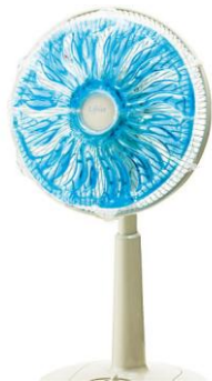
冷たいよう (品番：TG-672) 1,980 円 (税込)

冷蔵庫で冷やして扇風機に取り付けるだけで、打ち水のような涼風を味わえるお役立ちアイテム。エアコン使用時に併用すると、エアコンを控えめにしても心地よさはキープできます。(使用条件にもよりますが、冷蔵庫で約 120 分冷やした後、打ち水のような心地よい風を約 45～60 分間楽しめます。) 繰り返し何回でも使えるエコ設計です。