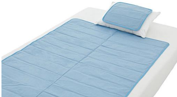
涼感ジェルパッド(温度調節機能付き) (品番：CZ-517) 1,990 円～8,990 円 (税込)

ひんやり感が長持ちし、熱帯夜にも最適な涼感ジェルパッド。中材のジェルは 30℃前後になると液体化して熱を吸収。パッドの中を移動しながら吸熱と放熱を繰り返し、ひんやり感を持続します。身体が離れると放熱するので、寝返りを打つ度にひんやりし、冷房の使用を抑えられ節電に役立ちます。頭・背中・上半身・全身と、欲しいところに使える 4 サイズ展開です。