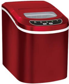
NEW 高速製氷器 (品番: XL-735) 19,800円 (税込)

水を入れてから氷ができるまで約10分。必要な時だけ氷を作ることができるので、冷蔵庫の電気代の削減にも。用途に応じて2サイズの氷を作れます。場所を取らないコンパクトボディで操作も簡単です。