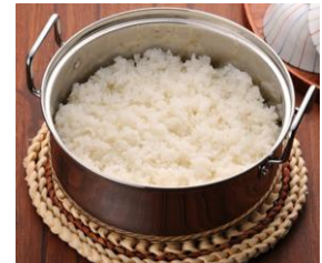
生活応援隊保温調理器 カンタン大好き (品番: VB-970) 9,800円 (税込)

短時間の加熱後、保温容器に入れておくだけのエコラク保温調理器。調理時間はレシピによって異なりますが、たとえば長時間の加熱が必要な肉じゃがも、5分程煮込んだ後は火加減も気にすることなく、鍋ごと保温容器に30分程度入れておくだけで完成します。また、保温容器に入れておけば料理が冷めにくく、時間が経っても温かい食事が楽しめます。付属のパッキンやバンドを使用すれば、鍋に入れた料理が零れにくくなるので、アウトドアでも活躍します。