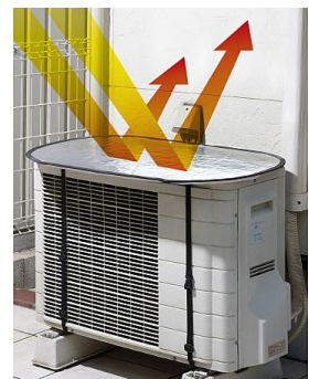
エアコン室外機遮熱テント (品番：WD-739) 1,344 円 (税込)

エアコン室外機には部屋の熱を外に放出する働きがありますが、室外機の付近が高温になると、熱を捨てる効率が低下し余分な電力消費の原因に。こちらのアイテムを使えば、高温の原因となる夏の直射日光と太陽熱を遮って、室外機の負担を軽減してくれます。ベルトで巻いてとめるだけで簡単に設置でき、ホコリや汚れからも守ります。