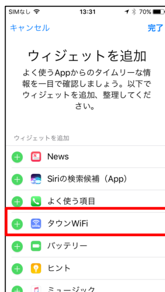
▲ウィジェット追加一覧画面