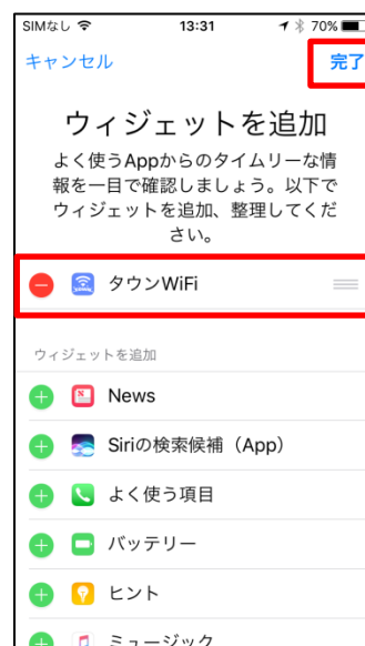
▲一覧からタウン WiFi を選択、完了

タウン WiFi は、今後も、携帯回線のようにどこでも Wi-Fi に繋がり、世界中のどこでも無料でネットが使える環境構築を目指して邁進してまいります。