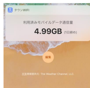
▲データ通信量表示イメージ

本機能は、月々に使用した通信量を簡単に把握したいというスマホユーザーのニーズに応え開発いたしました。これまでは、データ通信量を確認するためには、携帯キャリアのサイトを開く、もしくは専用アプリをインストールする必要性がありました。タウン WiFi では、スマートフォンのホーム画面に通信量をウィジェットとして常時掲載することで、その手間を一気に解消。さらに通信量を表示する締め日をアプリ上で設定することができるため、キャリアごとに異なる携帯料金の締め日にも対応しています。