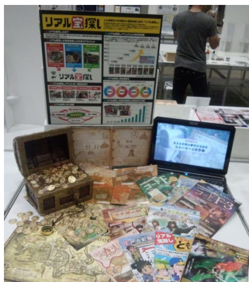
グッドデザイン賞への出展作品と出展時の様子