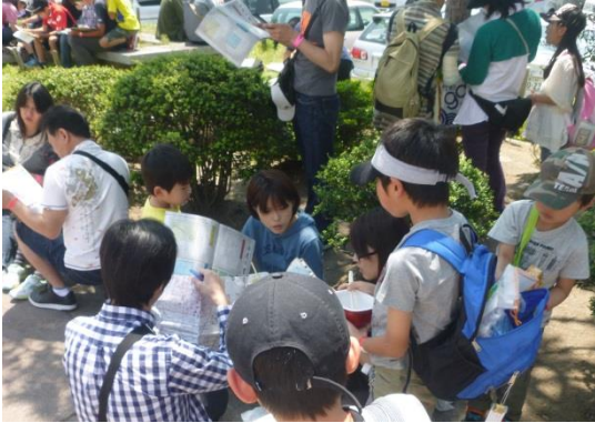
大人も子供も夢中になって宝の地図の暗号を解読

宝探しのテーマやストーリーには地域の伝統や文化、歴史、商品であれば特色を織り込むことで、自然に情報を取り入れることができ、魅力のPRにも繋がります。