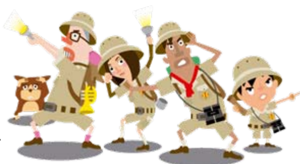
あなたの指示を待つ「現地調査班」メンバー

それらの情報やアイテムを駆使して更に解読を進め、最終的に宝物のありかを特定していく、本格的な室内型リアル宝探しイベントです。