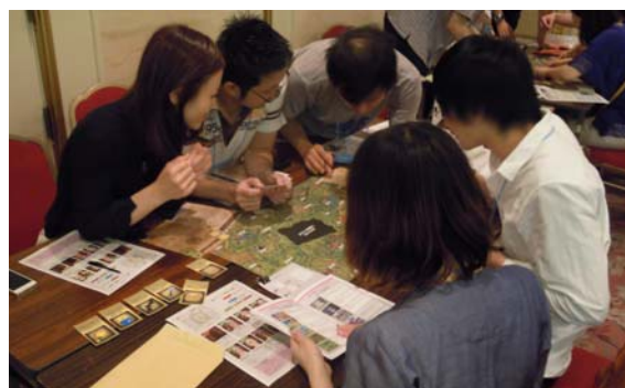
チームで力を合わせ、難解な暗号を解読！