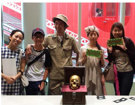
見事「黄金ドクロ」を発見！！