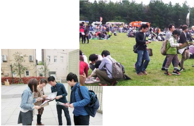
夢中になって宝の地図(参加冊子)の暗号を解読

また、宝探しのテーマやストーリーに、地域の伝統や文化・歴史、商品などもの特色を盛り込むことで、自然に現地の情報を取り入れることができ、魅力のPRにも繋がります。