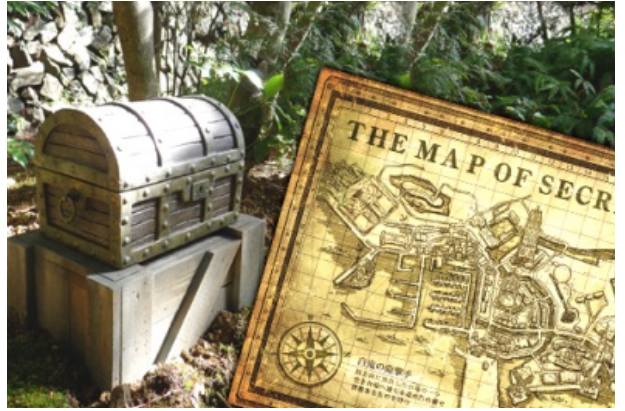
クオリティにこだわった宝箱と宝の地図