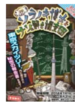
※2014年度上半期実施イベント一例