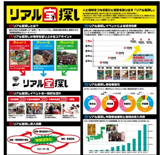
グッドデザイン賞への出展作品