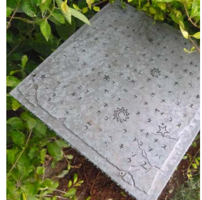
暗号を解読し、6つの石版を見つけ出そう！ ※画像はイメージです