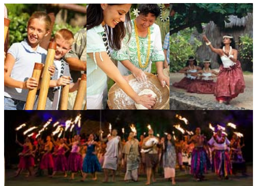
広大な敷地内ではゲームやショーなどイベント満載！

さらに、イブニングショーを上演するパシフィック・シアターに隣接した11,000㎡のスペースに、入場・駐車場無料のショッピングエリア「フキラウ・マーケットプレイス」が2015年2月20日にオープンしました。