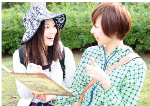
謎を解き、“イカした烏賊”を探し出そう！※画像はイメージです

函館市内の観光スポットやデビュー20周年を迎えたGLAYメンバーゆかりの地等を巡りながら、新鮮な魚介類などグルメも満喫していただきたいと思います。