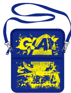
「GLAYと宝探し」オリジナルグッズ※画像はイメージです