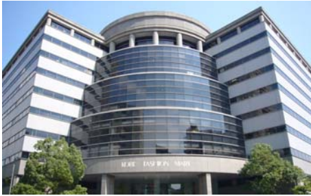
神戸ファッションマート外観

神戸ファッションマートは、環境やアクセスの良い阪神間の真中に位置する、延床約10万㎡のオフィス・ショップ・貸し会場からなる大型複合施設です。今回は施設内の9階に位置するイベントスペースにて「地獄」「煉獄」「天国」の三界を設定。参加者の皆様にはこの三界を旅していただきます。