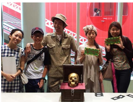
見事「黄金ドクロ」を発見！！