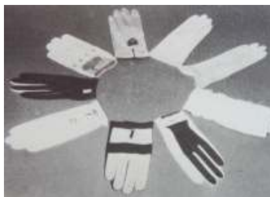
<初期の各種スポーツ用グローブ>