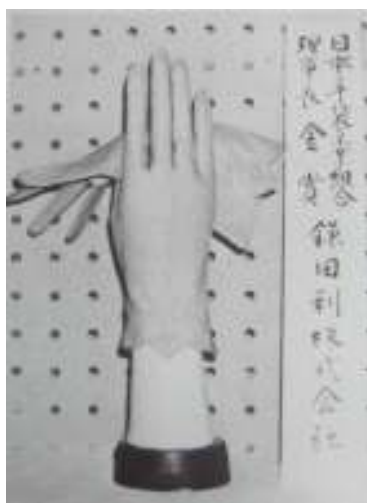
<草創期のドレス手袋>

また、キャスコのゴルフグローブは世界のトッププロにも認められ、米国で30%のシェアを確立。アメリカやイギリスの名門コースで活躍しました。