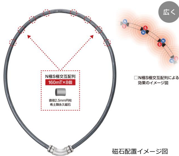
磁石配置イメージ図