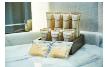
オムニサンス・パリ