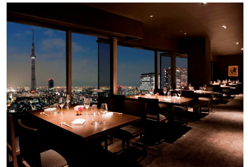
レストラン&バー「簾」 テーブル席（一例）