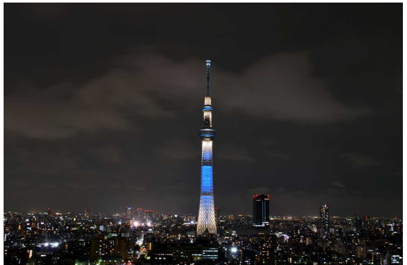
ホテルから見た東京スカイツリー