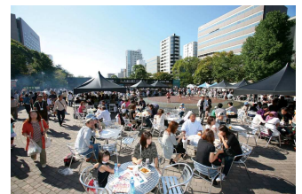
さっぽろオータムフェスト (イメージ)