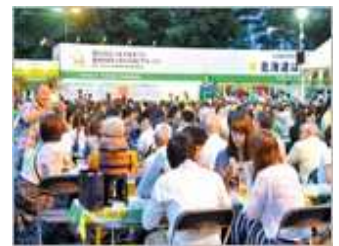
さっぽろ大通ビアガーデン (イメージ)

●利用できる会場：さっぽろ夏まつり「さっぽろ大通ビアガーデン THE サッポロビアガーデン(8丁目)」