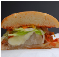
(ジャンボホタテバーガー)