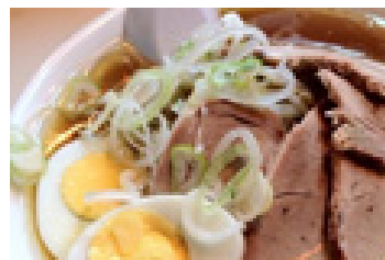
(“こぐま”のラーメン)