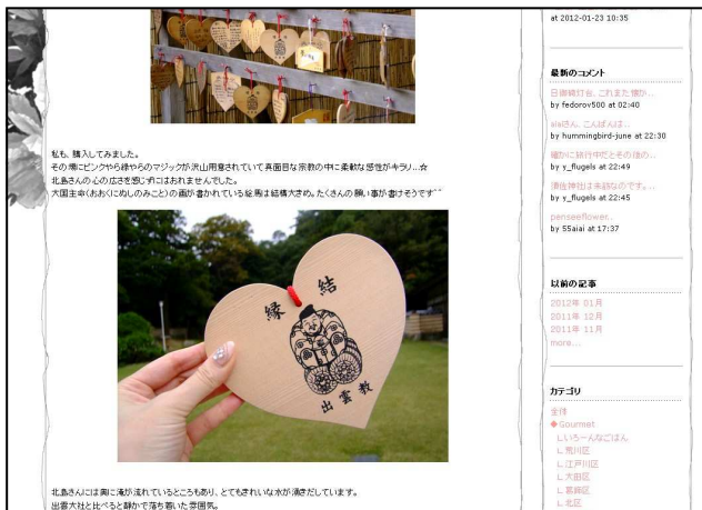
「じぶん日記」(北島国造館)