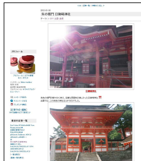
「秘書 OL キレイのヒ・ミ・ツ☆」 (日御碕神社)