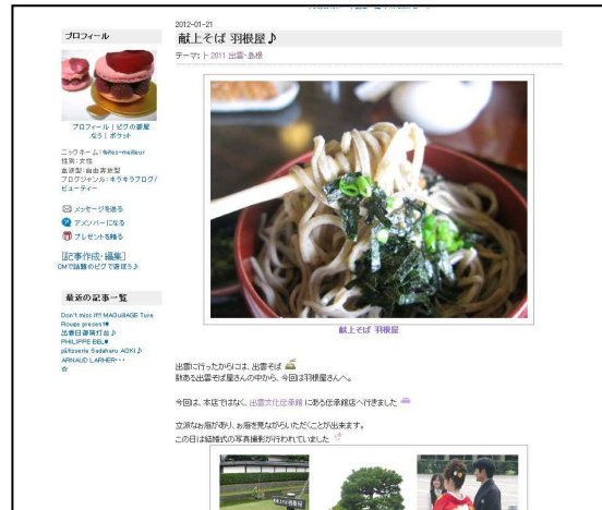
「秘書OL キレイのヒ・ミ・ツ☆」 (羽根屋の献上そば)