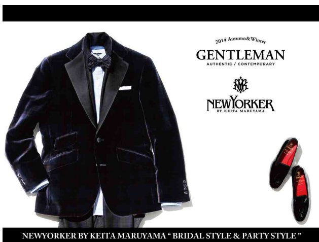
NEWYORKER BY KEITA MARUYAMA "BRIDAL STYLE & PARTY STYLE"

http://www.ny-onlinestore.com/special/keitamaruyama/140926_dressup.php