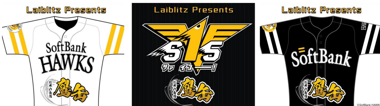
ラベルはホームとビジターのユニフォーム、2020年のスローガン「S15（サイコー！）」をデザインした3種類