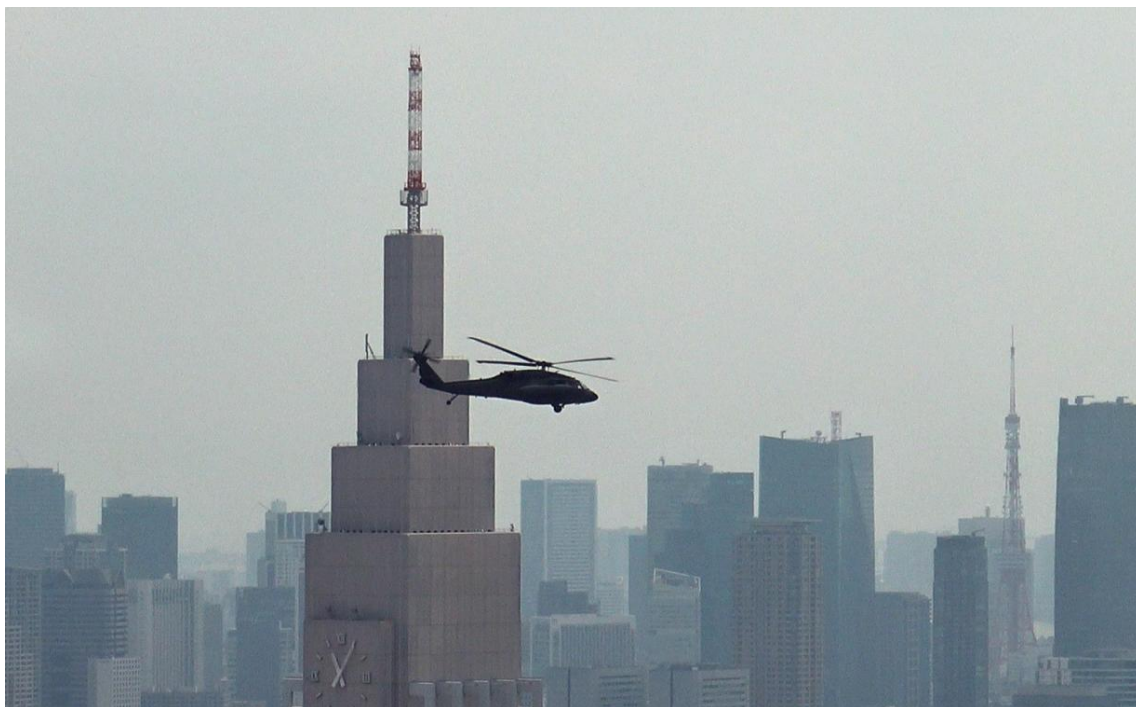
東京都渋谷区にある高さ約270mのビルより低く飛ぶ米軍ヘリ

おোগき あつし 1963年生まれ。主な生育地は千葉県船橋市。1986年一橋大学経済学部を卒業後、NHKに入局。プロデューサーやディレクターとして「新・電子立国」「文明の道」「新・シルクロード」「二重被爆 ヒロシマ・ナガサキを生き抜いた記録」「Brakeless JR 福知山線脱線事故」など。2019年から桜美林大学教授。