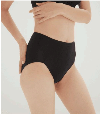
ハイウエストショーツ ¥2,200(税込)