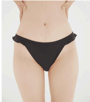
フレアショーツ ¥1,950(税込)