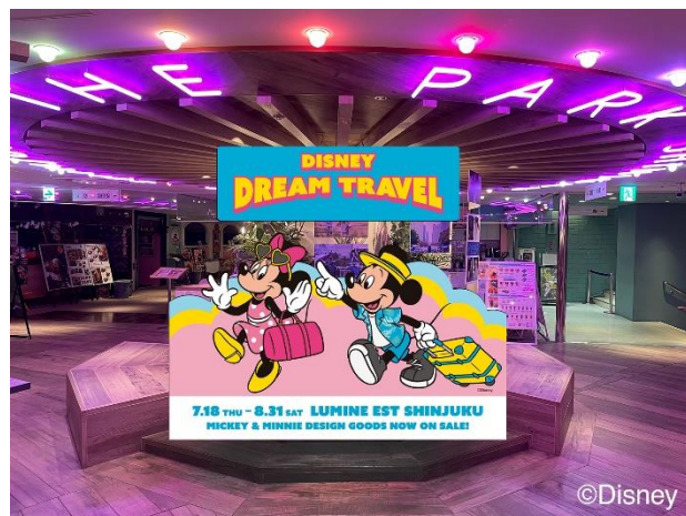
【8F レストランフロア『The PARK SHINJUKU』】