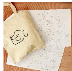
堀出 隼 (holiday)