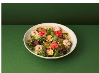
バジルチキンと海老のサラダ