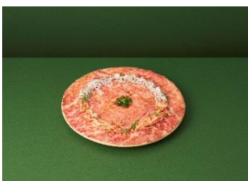
桜えびとしらすのサーロインユッケ