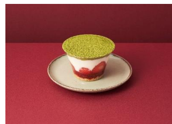
苺と抹茶のカップムース