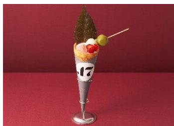
SAKURA香る 春のクレープ

・特設サイト： https://www.newoman.jp/yokohama/feature/?cd=000338