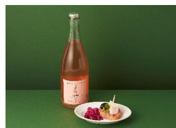
生ハム×スパークリング

8F THE CITY BAKERY BRASSERIE RUBIN 1,980円（税込）