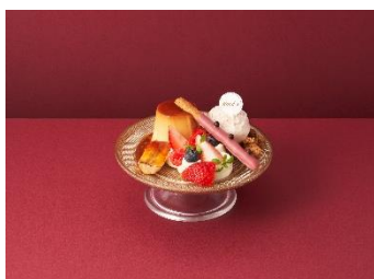
プリンアラモード ～桜のアイス添え～