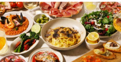
PUPA メニューイメージ