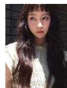
空 みれい @mirei_sora