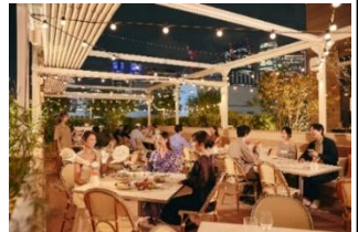
THE MED TERRACE イメージ