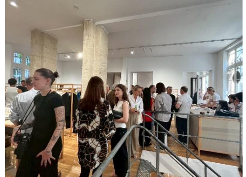
オープニングイベントで賑わう店内