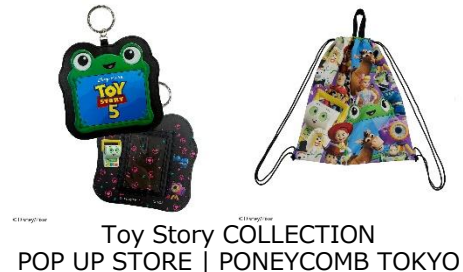
Toy Story COLLECTION POP UP STORE | PONEYCOMB TOKYO