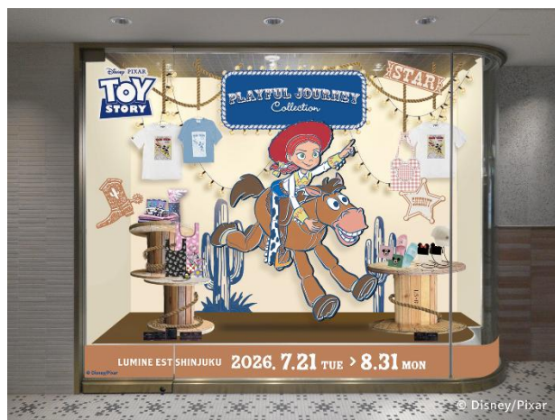
【B1 北側ショーウィンドウ】