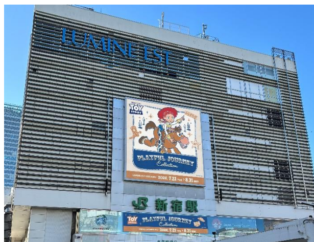
【屋外巨大サイネージ】