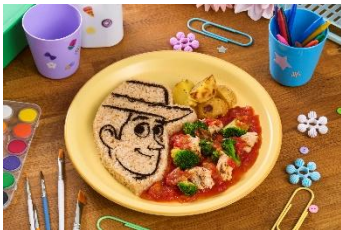
ボックスカフェアンドスペース