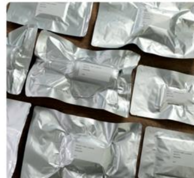
「旅じたくBOX」イメージ