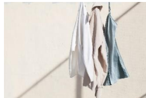
▲ SHIMAI VINTAGE (ヴィンテージ)