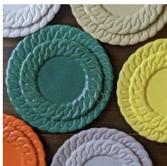
▲NAOKO HATA CERAMICS (陶磁器)