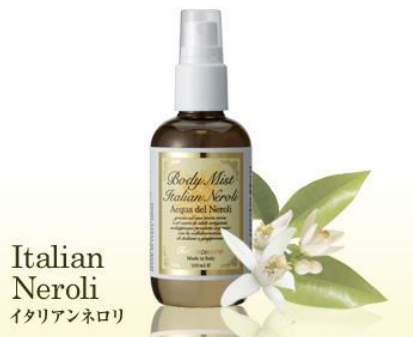
Italian Neroli イタリアンネロリ