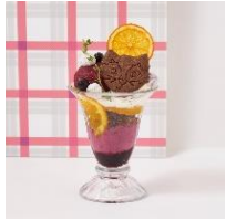
ルミネ1・3F カフェ&ブックスピリオテーク

※展開期間はショップにより異なります ※入荷状況により予告なく内容を変更する場合がございます