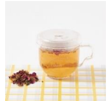
ルミネ2・B1 エンハーブ