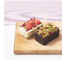
ルミネ2・1F ティーン&デルーカ

左：抹茶とあずきのミルクフィユ 右：アフォガード（抹茶/ほうじ茶） 各550円（税込）