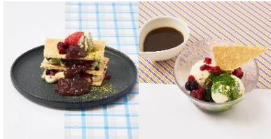
ルミネ1・8F 京都石堀小路 豆ちゃ

左：抹茶とあずきのミルクフィユ 右：アフォガード（抹茶/ほうじ茶） 各550円（税込）