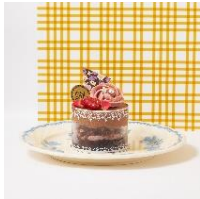
ルミネ1・4F ラブティ・メルスリー