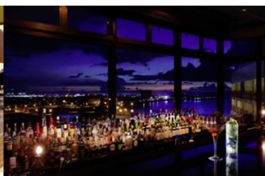
バー プラネットカウンター