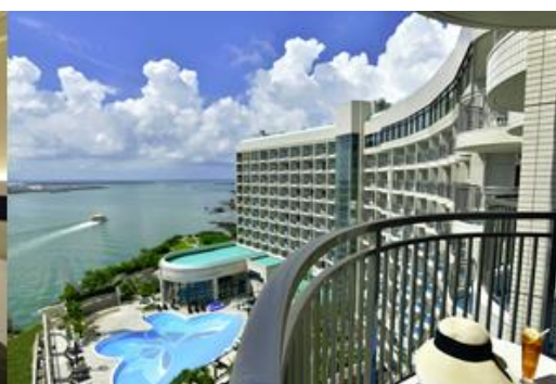
客室バルコニーからの願望