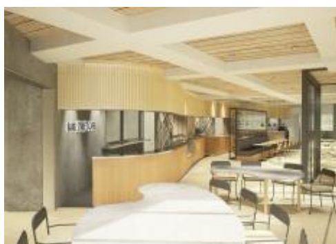
(写真左) ホテルレセプション (写真右) 飲食店 (写真左下) 飲食店 (写真右下) 客室(ツインルーム)