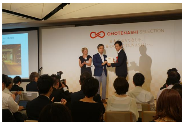
2018年8月23日に行われた授賞式の様子