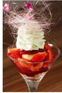
フリーズ・サラ・ベルナール