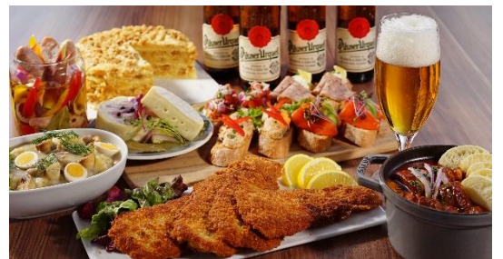
ビュッフェ料理イメージ

ミュシャの生まれ故郷であり晩年を過ごした地、チェコ共和国の郷土料理をアレンジした料理やスイーツの数々を、通常のビュッフェメニューに加えてご提供いたします。アルコールメニューには、ビールの消費量世界一を誇るチェコの代表的なビール「ピルスナーウルケル」もご用意いたします。