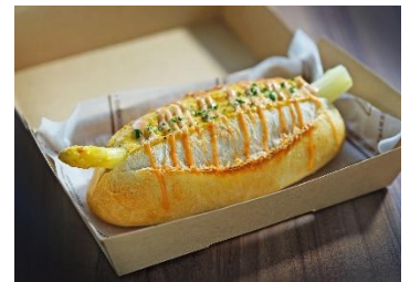
テイクアウトサンド （ホワイトアスパラ）

トップラウンジ店舗情報： https://www.royalpines.co.jp/restaurant_bar/toplounge