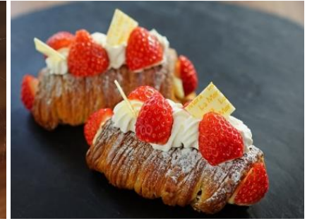
パインズ トルデルニーク

ラ・モーラ店舗情報： https://www.royalpines.co.jp/restaurant_bar/lamora