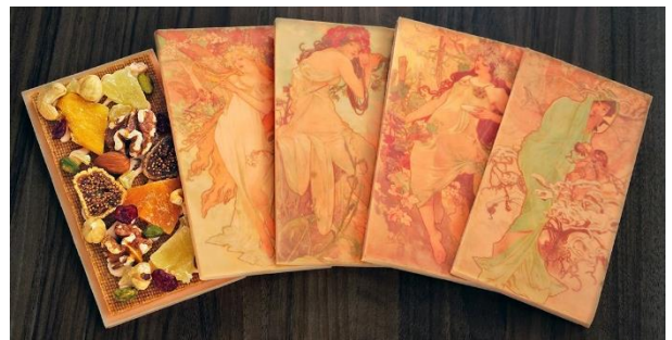
ミュシャ「四季」のタブレットショコラ

テイクアウトでは、ミュシャの代表作のひとつ「四季」をあしらったタブレットショコラや、チェコの代表的なスイーツ「トルデルニーク」をアレンジしたスイーツをご提供いたします。