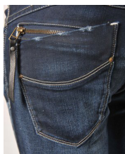
*ヒップのデザインジップ

シルエット:タイトストレート 素材 :綿98% ポリウレタン2% 価格 : ¥ 9,800- (税込) カラー :Blue / BlueGreen サイズ :XS,S,M,L