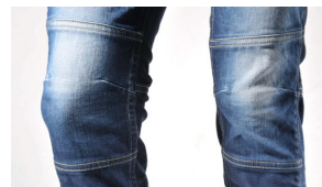
*膝の切り替えディテール

シルエット:タイトストレート 素材 :綿98%ポリウレタン2%(Blue)/ 綿96%ポリウレタン4%(Black) 価格 : ¥ 9,800- (税込) カラー :Blue / Black サイズ :XS,S,M,L