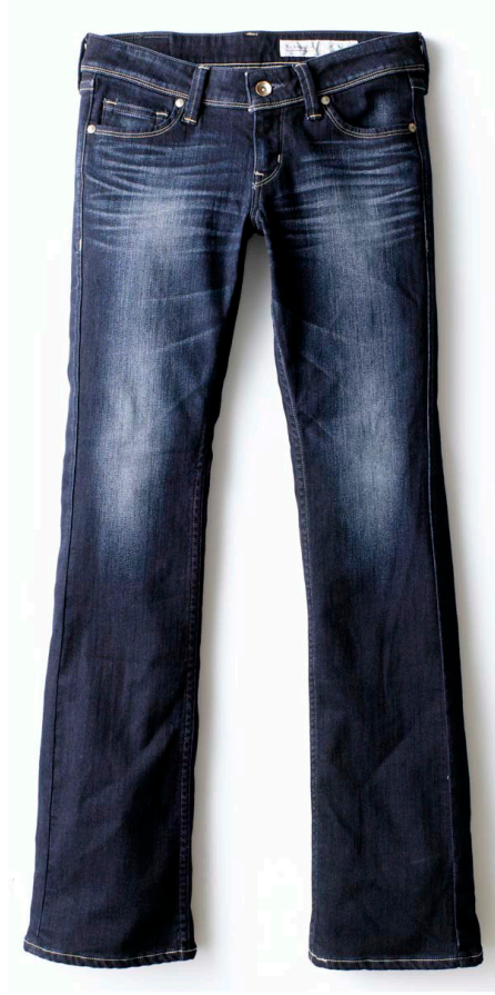
<Tight Boots Cut Fit/Blue >