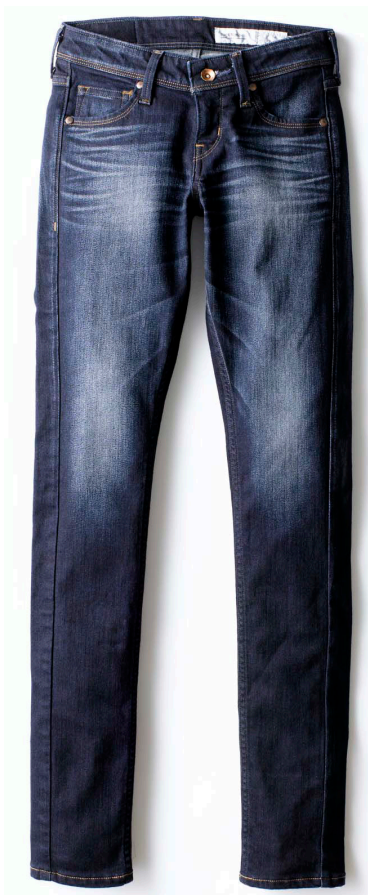
<Skinny Fit/Blue >

売上の一部を、”一般社団法人 LOVE FOR NIPPON”を通じて東日本大震災の復興支援にあてさせていただきます。 震災復興を願う松雪泰子とライトオンが、日本の女性に贈るスペシャルデニムです。