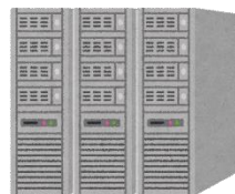
電力ビッグデータ