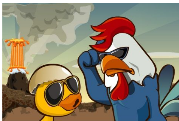
「GuGu」がお父さんと一緒に冒険するショートアニメも楽しさいっぱい！